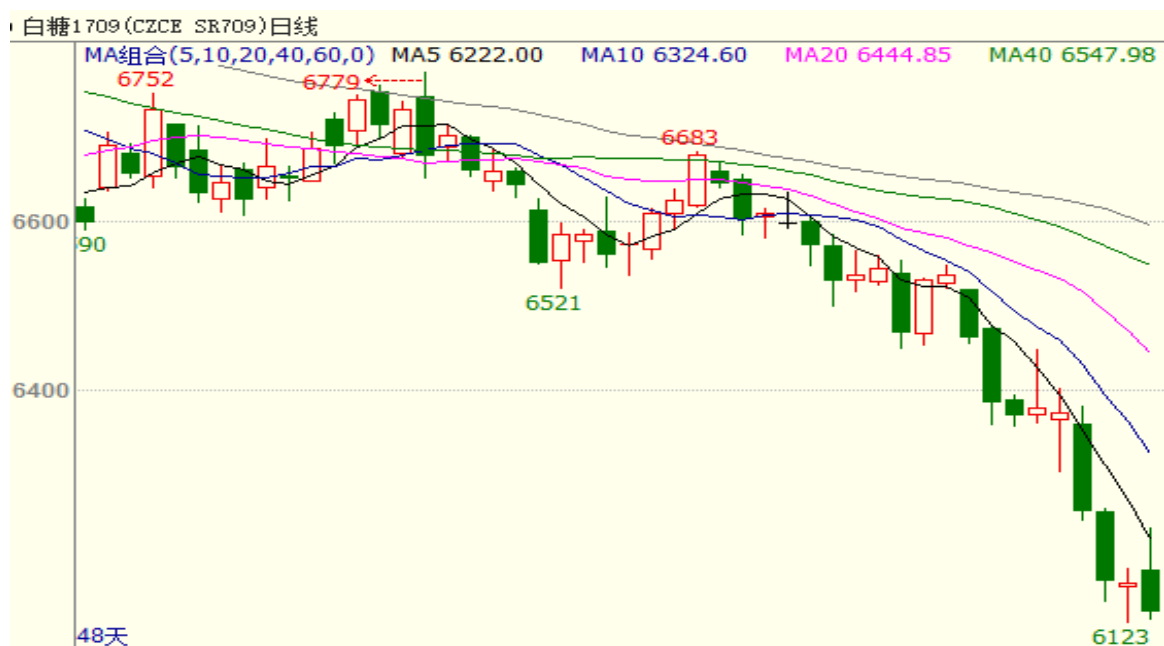
图 1 主力合约白糖 709 行情

7月7日白糖主力期货合约SR1709大幅破位下挫，周一开盘6365，周五收盘6137，周跌幅为3.58%。