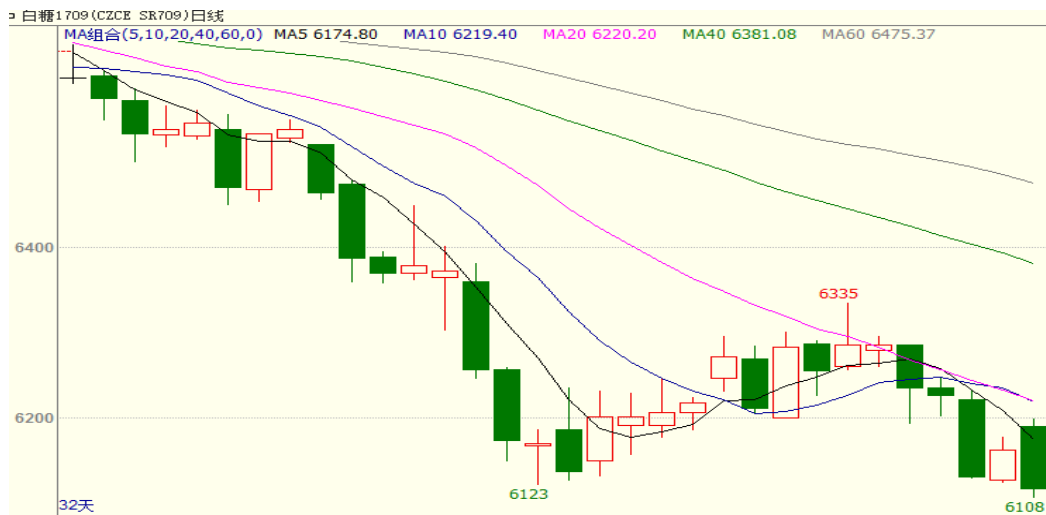
图 1 白糖 709 期货行情

7月24日当周白糖期货合约弱势下行，SR1709周一开盘6285，周五收盘6118，周跌幅为2.66%；SR1801周一开盘6272，周五收盘6046，周跌幅为3.6%