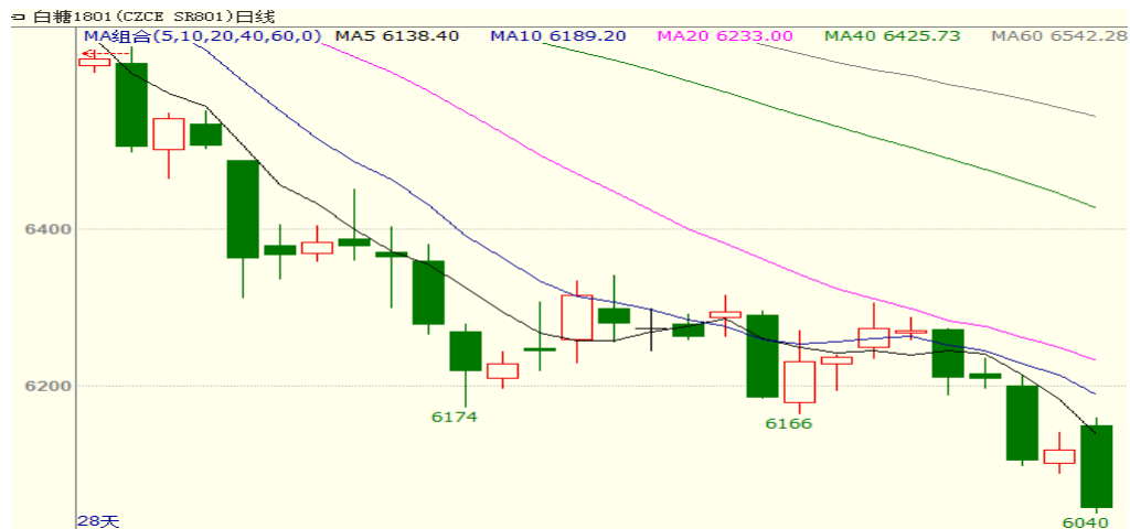
图 2 主力合约白糖 801 行情