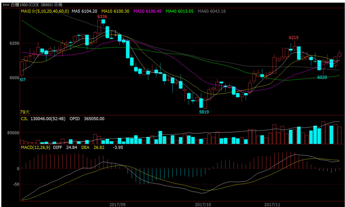
图 1 白糖 1805 期货合约行情

11月20日当周白糖合约SR1805周一探底6020后，呈现强势震荡，周一开盘6050，周五收盘6143，周涨幅为1.52%。