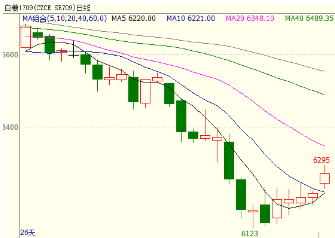
图 1 主力合约白糖 709 行情

7月10日当周白糖主力合约SR1709低位反弹，重心向上微移，周一开盘6150，周五收盘6272，周涨幅为1.98%，报收五连阳。