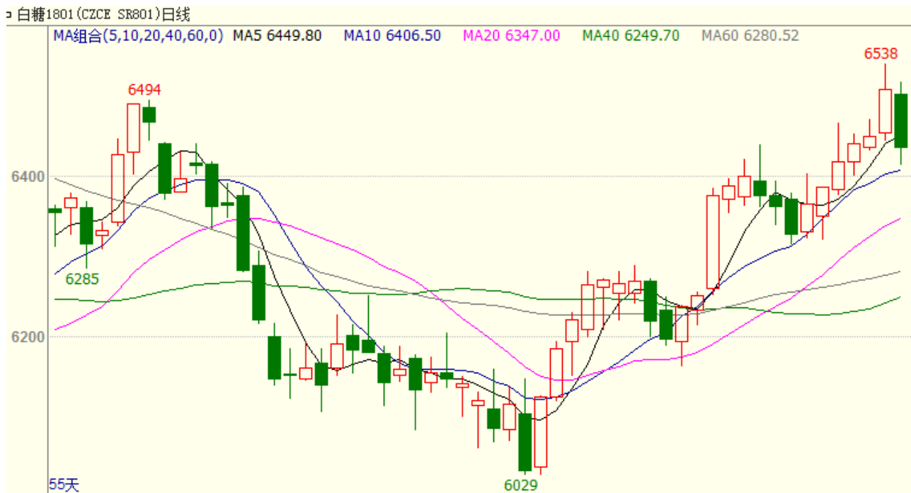
图1 主力合约白糖1801行情

11月06日当周白糖合约SR1801周一至周四持续增仓上涨，最高价到达6538，但周五有所回落，周一开盘6383，周五收盘6435，周涨幅0.81%。