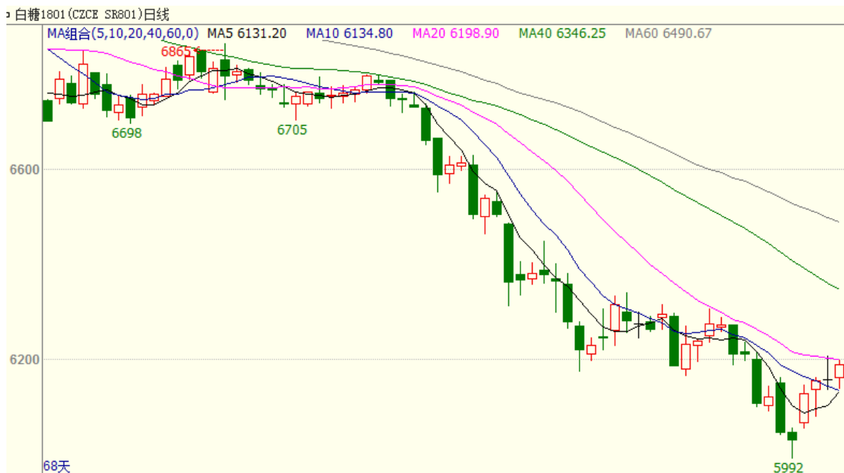
图 1 主力合约白糖 1801 行情

7月31日当周白糖合约SR1801底部反弹，周一开盘6045，周五收盘6188，周涨幅为2.37%。