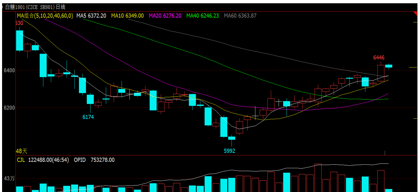
图 1 主力合约白糖 1801 行情

8月21日当周白糖合约SR1801继续反弹，周一开盘6359，周五收盘6427，周涨幅为1.07%。