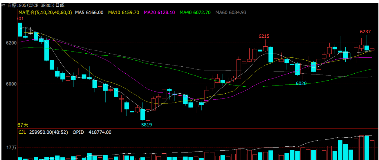
图1 白糖1805期货合约行情

12月04日当周白糖合约SR1805周三探顶6237后，呈现弱势震荡，周一开盘6127，周五收盘6179，周涨幅为0.85%。