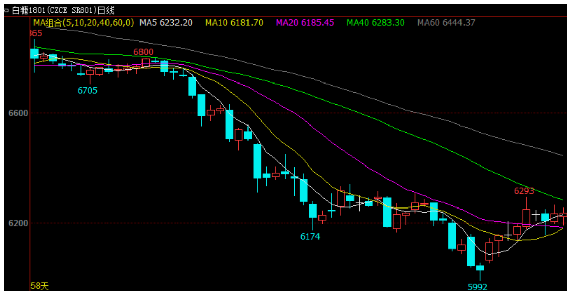
图 1 主力合约白糖 1801 行情

8月7日当周白糖合约SR1801平稳整理，在6156至6293点相当狭窄的区间里保持着小幅波动的走势，周一开盘6187，周五收盘6238，周涨幅为0.82%。