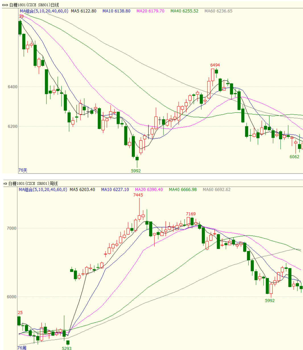
图 1 主力合约白糖 1801 行情

9月25日当周，白糖期货合约SR1801呈弱势窄幅振荡，振荡区间位于6100-6200之间，周一开盘6155，周五收盘6117，周跌幅为0.61%。